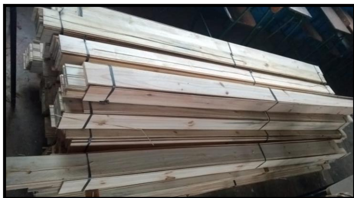
Pisos e forro