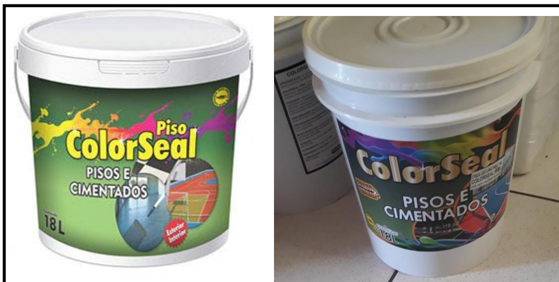
Tinta para piso