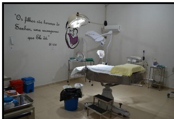
Instalações do Hospital de Maternidade de Ribeirão do Pinhal