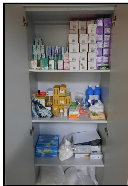
Compressores e material odontológicos