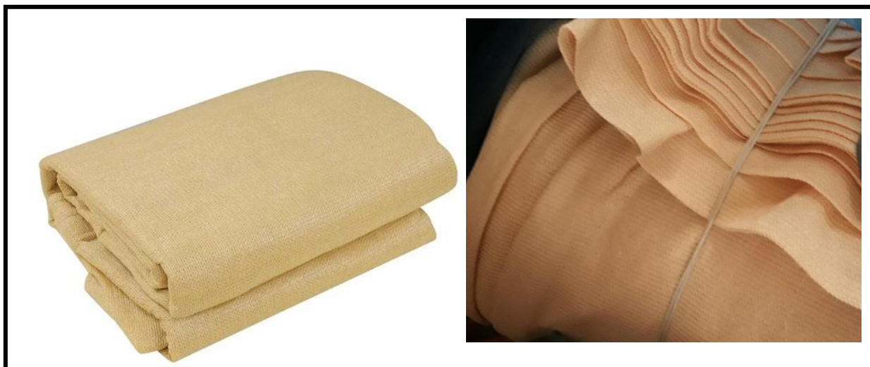
tela de sombreamento