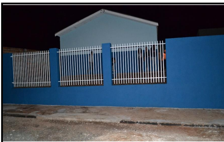
Centro Comunitário do Conj. Tótó Carvalho