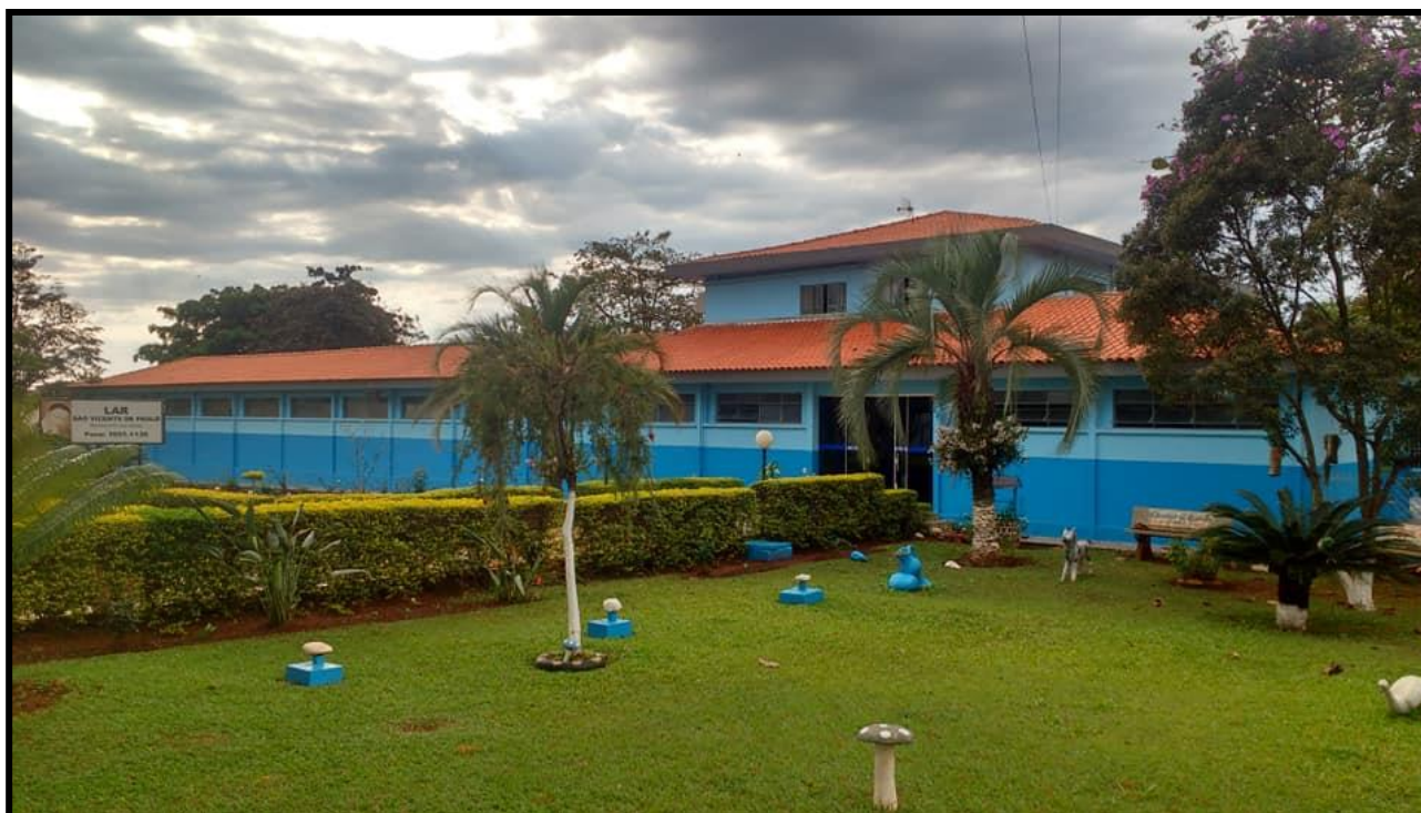
Lar São Vicente de Paulo de Ribeirão do Pinhal