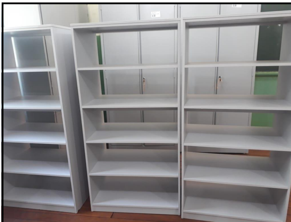
Armários da Escola Municipal Dr Marcelino Nogueira