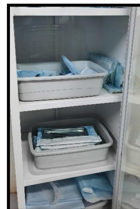
Medicamentos e equipamentos odontológicos