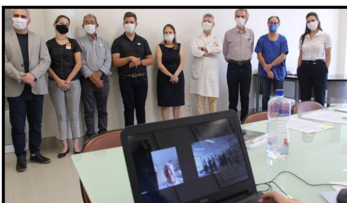
Assinatura do Convênio com Hospital do Câncer de Londrina