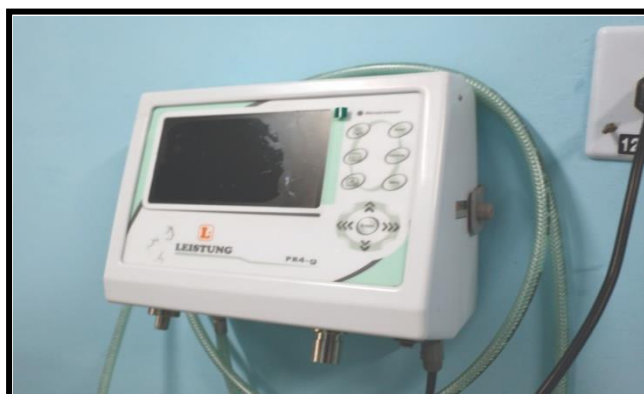
Ventilador Eletrônico Microprocessado instalado no Hospital e Maternidade de Ribeirão do Pinhal