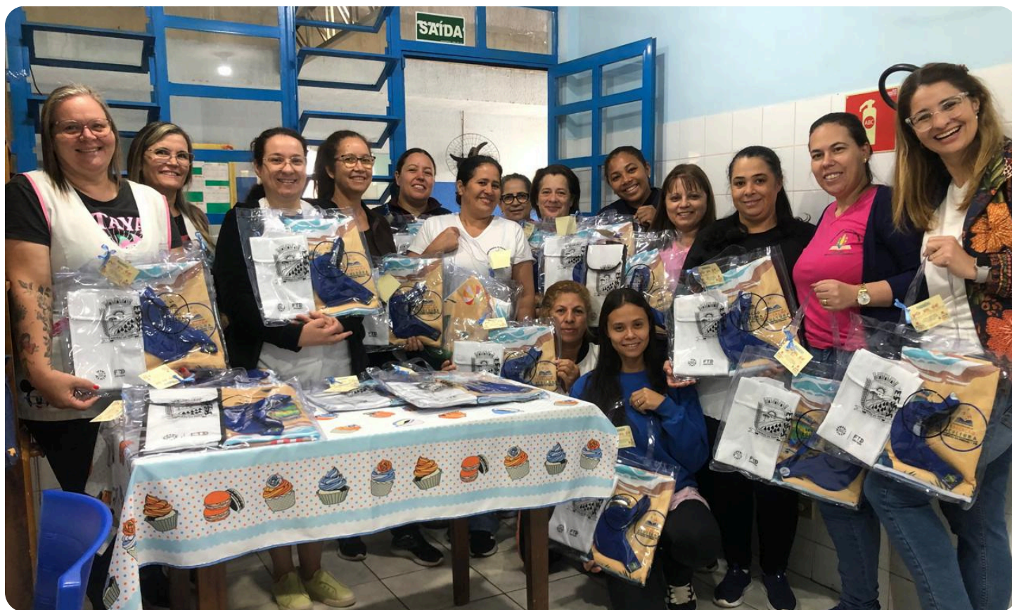
CMEI Vó Zaíde

Dentro de cada bolsa, havia uma toalha de banho , uma bolsa térmica e uma viseira , itens pensados com muito carinho para demonstrar o apreço e a gratidão por todo o trabalho, dedicação e amor que os professores depositam diariamente em suas práticas pedagógicas. ❤️