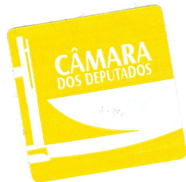
FELIPE FRANCISCHINI Deputado Federal PSL/PR